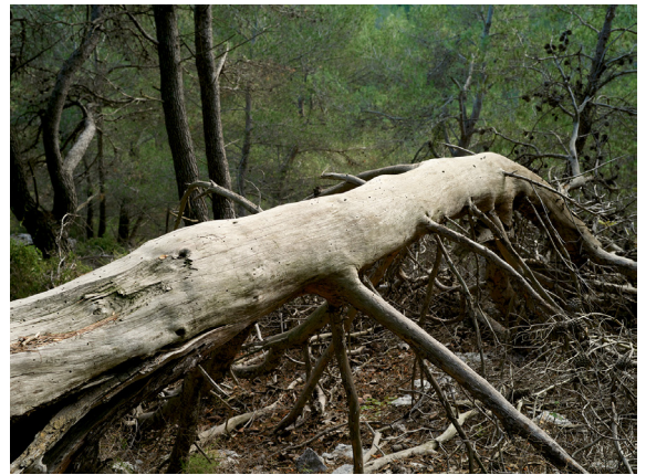
Tirage lambda, tirage limité 1/8 signé