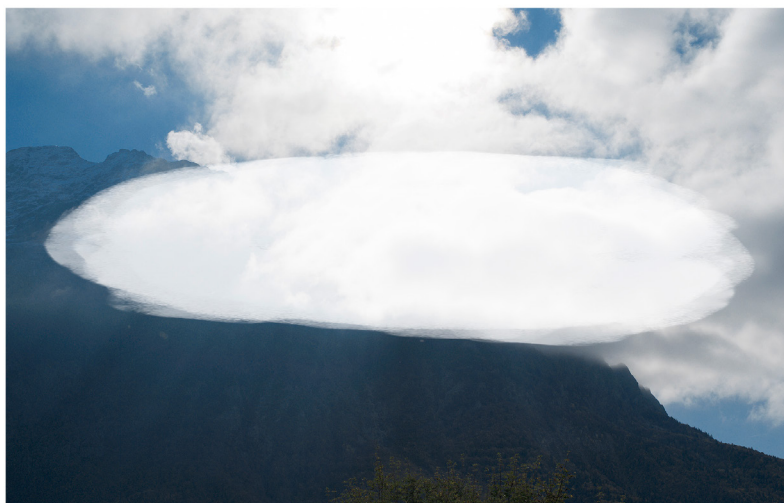
Masque, tirage lambda RC, 12,5x20 cm - Patrick Rimond 2022